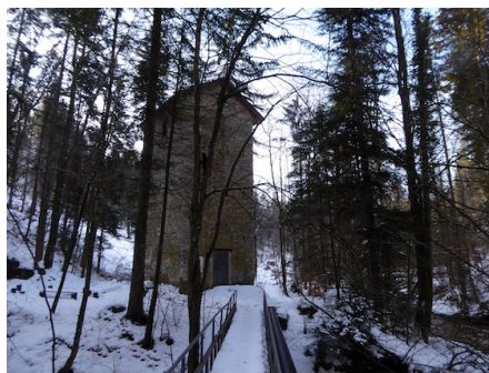
Mittlerer Tobelturm am Aabach (Näheres dazu vor Ort)