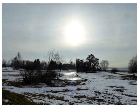
Stimmung in der Rietregion