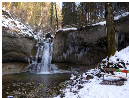
Moräne des Linthgletschers und deren Untergrund werden sichtbar