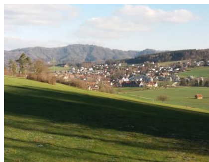
Aesch und Uetliberg