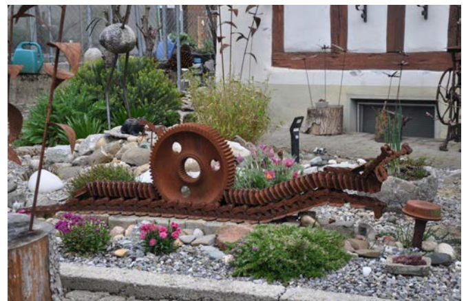
Riesen-Zahnradschnecke in Berg am Irchel