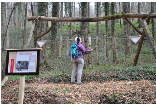
Naturlehrpfad Neftenbach mit Waldxylophon