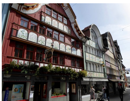
Strassenzug in Appenzell