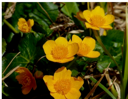
Das Moor blüht