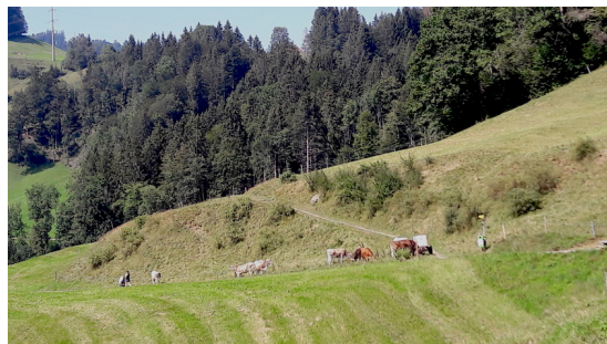
Aufstieg Richtung Etzelpass