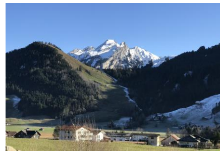
Fluebrig von Unteriberg aus gesehen

Durchführung: Grundsätzlich bei jeder Witterung. Auskunft bei Unklarheiten: Fredy Laimbacher 044 764 06 44 oder 079 587 17 79