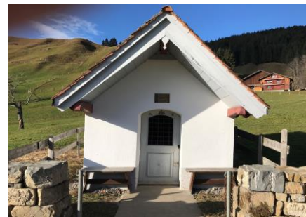
Kapelle der hl. Ottilia, Patronin der Armen und Blinden

Ausrüstung: Gutes Schuhwerk, eventuell schneegängig! Winterkleidung: Wir wandern auf 900 m über Meer Genügend zu trinken, ev. ein warmes Getränk (Notfallausweis im Portmonee)