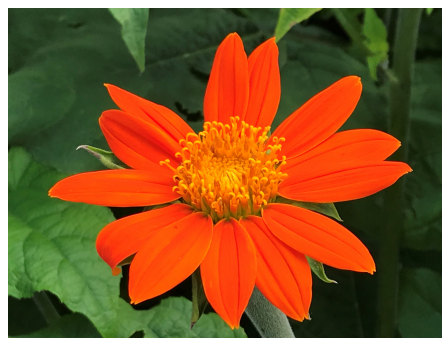
Trichtermalve oder Brillantrose

Tagesprogramm: Besammlung: Hausen+Ebertswil: PP Vitaparcours 08.30 Uhr Kappel: Im Klostergarten: 09.30 Uhr Uerzlikon: Beim rostigen Traktor: 10.15 Uhr Zurück in Hausen / Vitaparcours: vor 15 Uhr Zurück in Kappel oder Uerzlikon: etwas früher