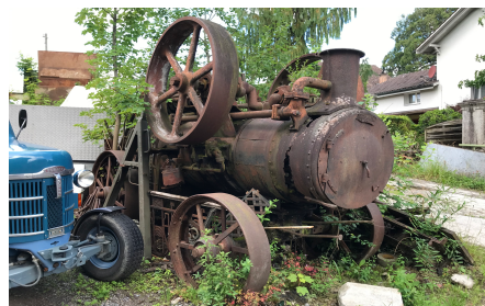
Dinosaurier- Traktor in Uerzlikon

Ausrüstung: Gutes Schuhwerk Kleidung der Witterung angepasst. Evt. Stöcke. Tages-Picknick Sonnen-, Mücken- und ev. Regenschutz. GENÜGENDE ZU TRINKEN Evt. Gesichtsmaske Notfallausweis im Portmonee