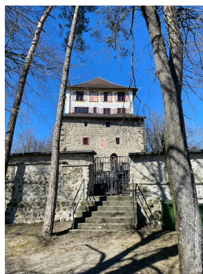
Blick auf Schloss Mörsburg

Dieser Anlass ist vom Bundesamt für Sozialversicherungen subventioniert, weil er altersspezifischen Beeinträchtigungen entgegenwirkt.