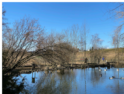
Weiher bei Seuzach

Wanderungstyp: Leichte Tageswanderung mit wenig Höhenunterschied.