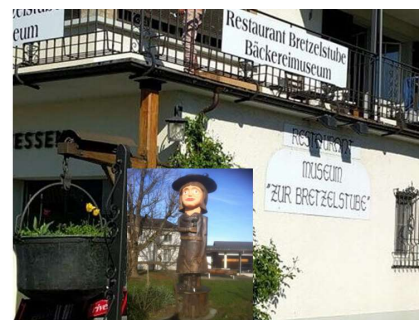
Restaurant und Bäckereimuseum Bretzelstube