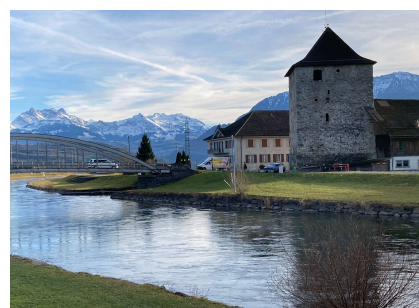
Schloss Grynau zwischen Uznach und Tuggen an der Linth