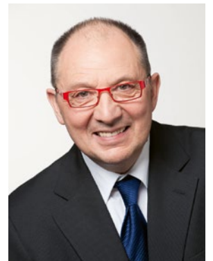
Mit Beni Thurnheer als Referent