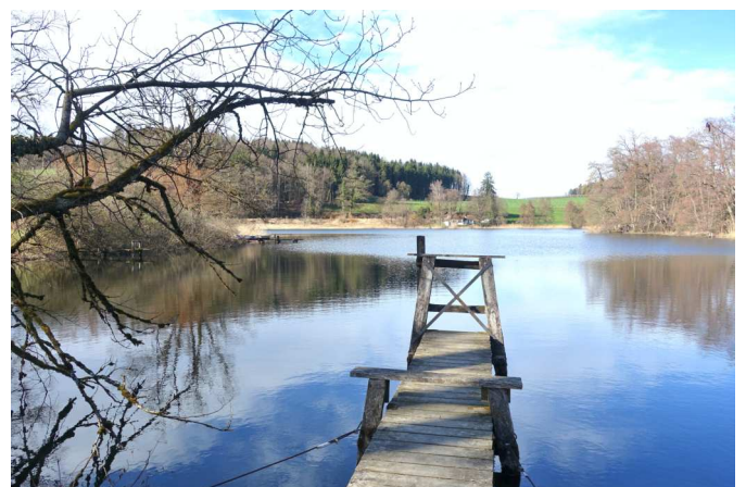
Horbacher Weier, einer der fünf Hauptwiler Fischweiher.

Diese Wanderung ist vom Bundesamt für Sozialversicherungen teilsubventioniert, weil sie in besonderem Masse die Selbständigkeit und Autonomie von älteren Menschen fördert.