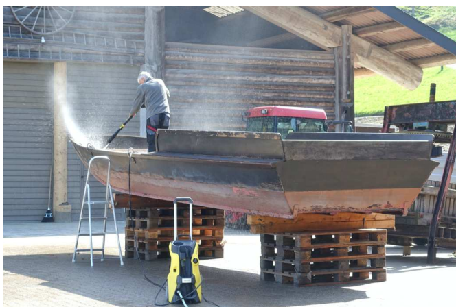
Die Fähre wird betriebsbereit gemacht (20.03.2024).