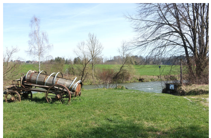
Fährelandestelle Gertau an der Sitter