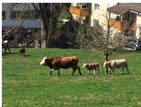
Auch sie sind unterwegs