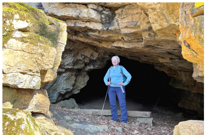
Bruderloch-Höhle an der Bettstigi in Wenslingen