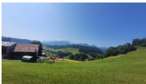
Ausblick Richtung Alpstein