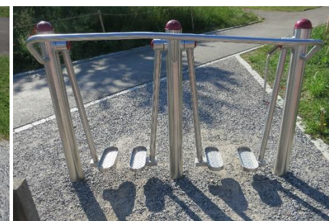
Tal Arena (oberhalb Tennisplatz)