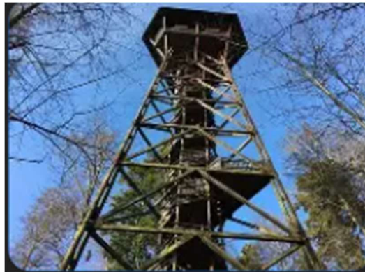
Aussichtsturm Lorenchopf 33 Meter hoch