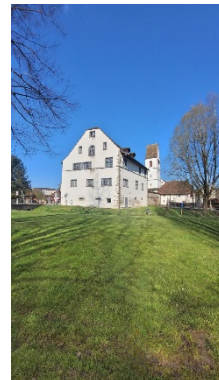
Schloss und Kirche