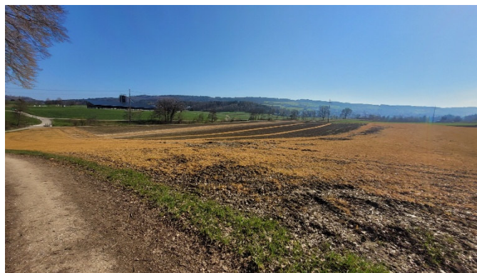
Mühlibach / Chrüzächer