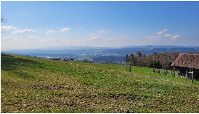
Blick zurück ins Reusstal